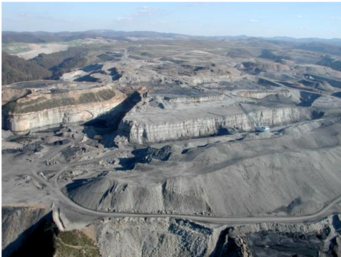
Figure 2 : Site MTR dans les Appalaches. Cliché V. Stockman

Sur le plan local, ce sont les impacts liés à l'extraction qui sont particulièrement dénoncés. Globalement, l'extraction dans le bassin ouest, ne soulève pas de préoccupation environnementale majeure. En effet, ces espaces sont peu peuplés (le Wyoming, premier Etat producteur, regroupe la population de Lyon sur un territoire de la taille du Royaume-Uni) et les extractions y sont très concentrées (les 10 principales mines du Wyoming produisent plus du tiers du charbon américain). En revanche, dans les zones charbonnières historiques des Appalaches, la méthode du Mountaintop Removal (ou MTR, aplanissement des reliefs permettant de mettre à nu les veines de charbon) engendre des dommages paysagers irréversibles et produit des amoncellements de stériles miniers qui, entreposés dans des barrages de fond de vallées, constituent des sources de pollution (acidification, métaux lourds). Ces stratégies d'extraction sont motivées par la recherche d'une diminution des coûts : actuellement, le rapport de productivité entre les bassins Ouest et Est avoisine un facteur 6.